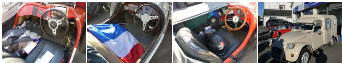
Des postes "Rikiki" de conduite sportive. Des tableaux de bord nus, l'électronique est dans la cervelle des pilotes. La voiture d'assistance pour les liquides de rafraichissements.