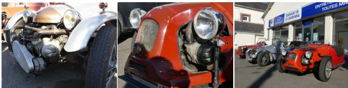
Des moteurs qui respirent la puissance.