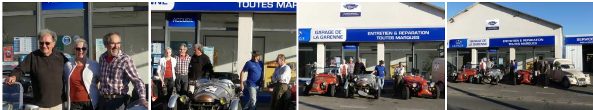
Tous avec la volonté, le plaisir et le sourire