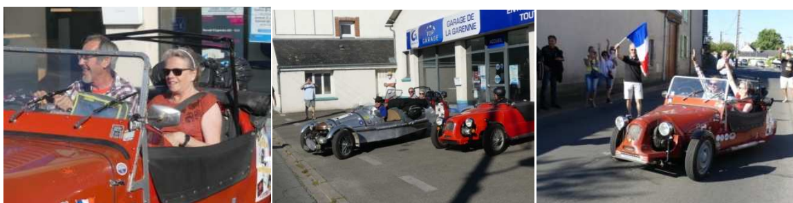
C'est parti pour l'aventure pour trois semaines. Ils sont heureux. Bon voyage les copains.