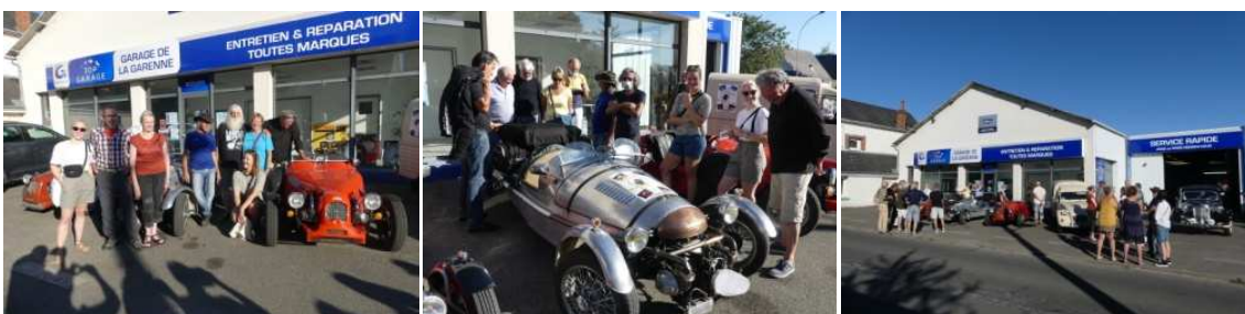
Les amis, les copains, mêmes des étrangers (Anglais, Allemands) étaient présents pour les encourager.