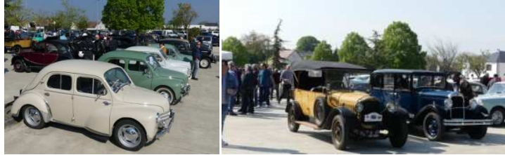
Des couleurs et du rare

C'était la fête des 4CV, mais les vieilles copines, De Dion Bouton et Citroën, étaient là.