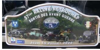
La VERMOREL (La doyenne de 1913) et ses vieilles copines.