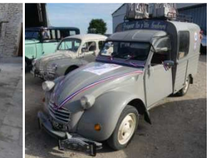
Elles se sont rassemblées de temps en temps pour ne pas se perdre.