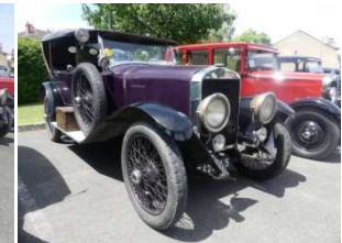
Et bien sur LA LICORNE était présente.