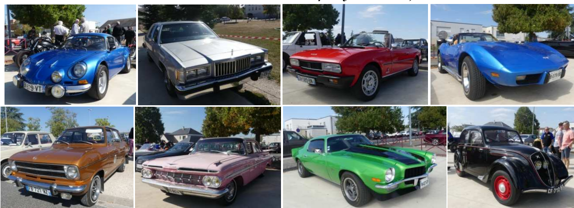
Des moulins à faire rêver.