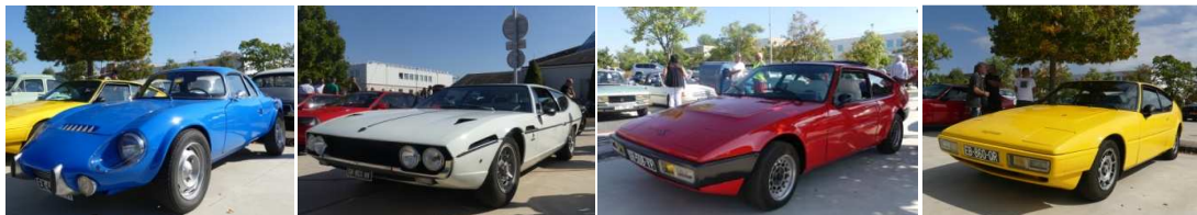
Des caisses de toutes les couleurs (d'origines bien sûr).

Du charme et même de la puissance pour plaire à tous, sur le parking de Beraire à La Chapelle Saint Mesmin.