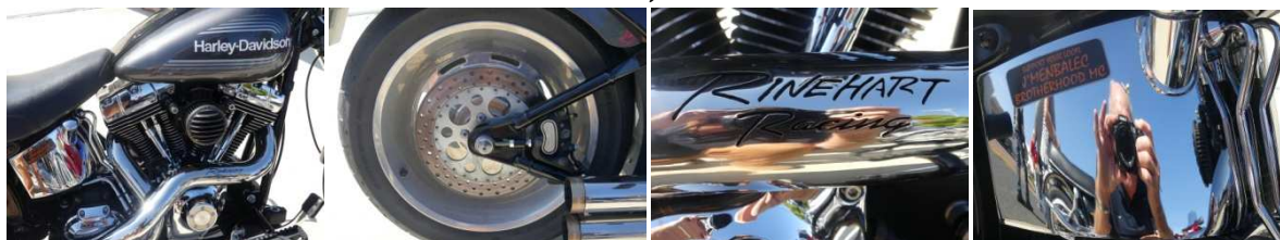
Des Signatures merveilleuses.